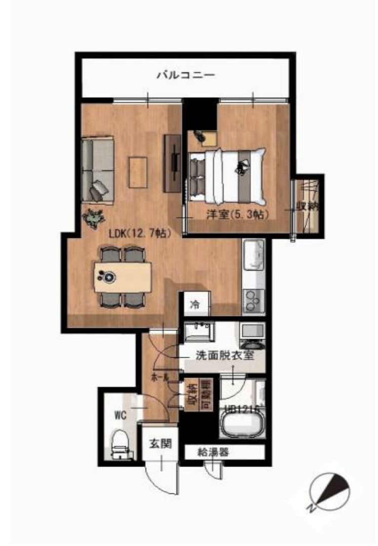
※写真はイメージ画像です